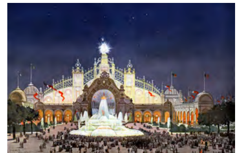
Palais de l'électricité à l'Exposition de 1900

Riche d'installations, de films, photographies et anecdotes inattendues, « Mondes Electriques » cherche avant tout à véhiculer l'émerveillement et l'enchantement associés à la découverte et à l'utilisation d'une denrée précieuse : l'électricité.